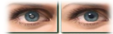
چشم معمولی آب مروارید چشم

بیماری است که در آن عدسی چشم کدر می شود. کدر شدن عدسی باعث کم شدن دید بیمار می شود.